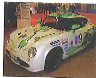
Voiture hybride PGO-EMASIA-DEHONDT.

Concrètement, les objectifs de FiMaLin® sont de maîtriser l'approvisionnement en fibres longues de lin (démarche qualité en cours avec la mise en place d'un label : Qualiflax®), de maîtriser la performance et la