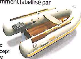
Zodiac Z-Concept dinghy.

Créer, structurer et promouvoir une filière "lin technique" dédié aux composites, au côté des fibres de verre et de carbone, c'est tout le sens de FiMaLin®. Cette nouvelle filière agro-industrielle démarre à la culture et s'achève avec les industriels finaux pour des cahiers des charges de plus en plus complexes intégrant l'écoconception. Témoin : le projet Fiabilin, premier projet d'ampleur industrielle sur les fibres de lin dans les composites en Europe. Récemment labellisé par