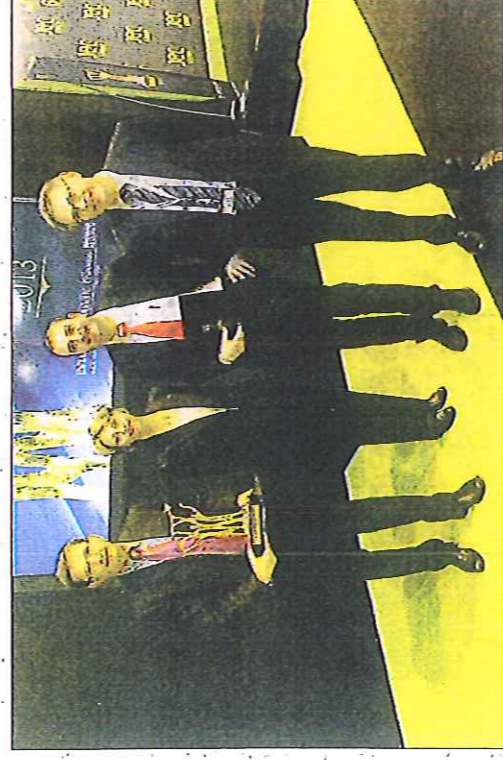
Édouard Philippe, 2 e à droite, lors de la remise du prix

Jeu de semaine, de 9 heures à 12 h 30, le consortium Fimalin présentera dans les locaux de la Région Haute-Normandie les premières applications industrielles, les projets collaboratifs en cours et les perspectives d'avenir en terme de nouvelles industries et de nouveaux métiers.